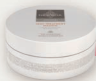
DEEP TREATMENT MASQUE

Für die optimale Pflege Ihrer Haare empfehlen wir zusätzlich 1 x pro Woche eine Anwendung mit der Newsha Deep Treatment Masque . Diese intensive Haarmaske mit wertvoller Sheabutter baut das Haar tiefenwirksam auf und reichert es mit Feuchtigkeit an. Das Newsha Luxe Treatment Oil kann ergänzend als Pflegeöl und Finisher verwendet werden, um den Glanz der Haare zu intensivieren.