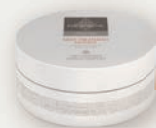
DEEP TREATMENT MASQUE

Für die optimale Pflege Ihrer Haare empfehlen wir zusätzlich 1 x pro Woche eine Anwendung mit der Newsha Deep Treatment Masque . Diese intensive Haarmaske mit wertvoller Sheabutter baut das Haar tiefenwirksam auf und reichert es mit Feuchtigkeit an. Das Newsha Luxe Treatment Oil kann ergänzend als Pflegeöl und Finisher verwendet werden, um den Glanz der Haare zu intensivieren.